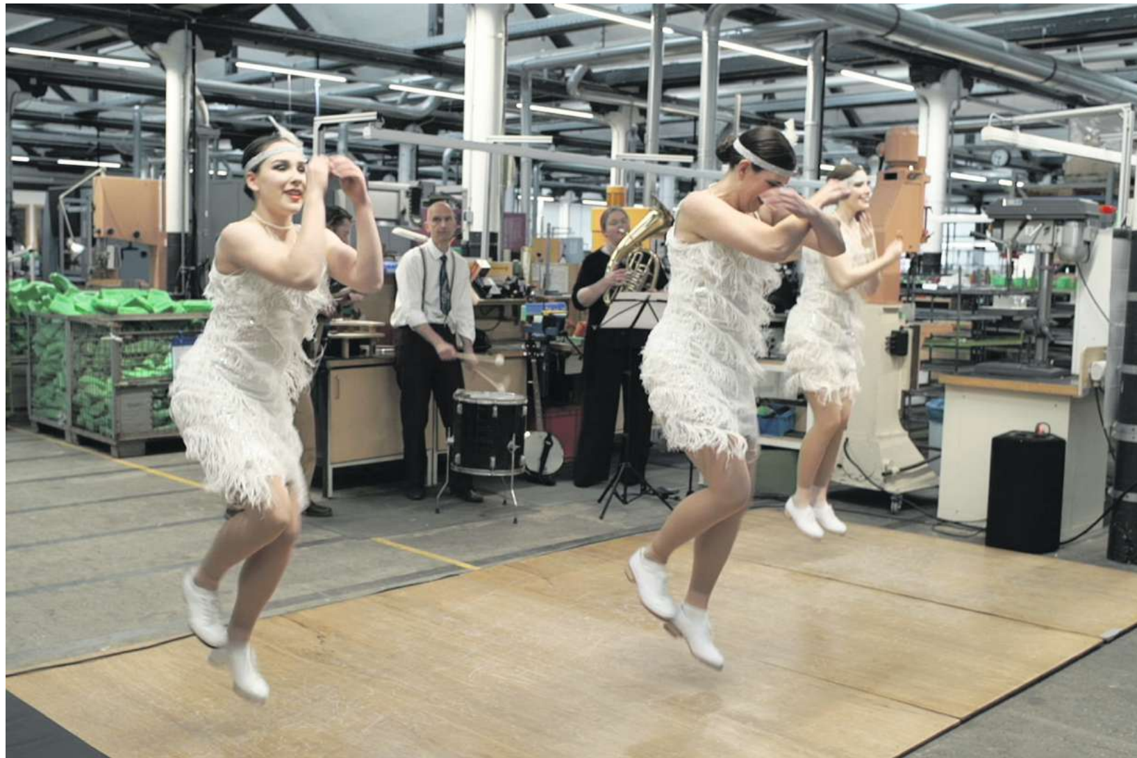
Das Forum Heersum hat für die Veranstaltung im Fagus-Werk Tänzerinnen von Ars Saltandi mit ins Boot geholt.